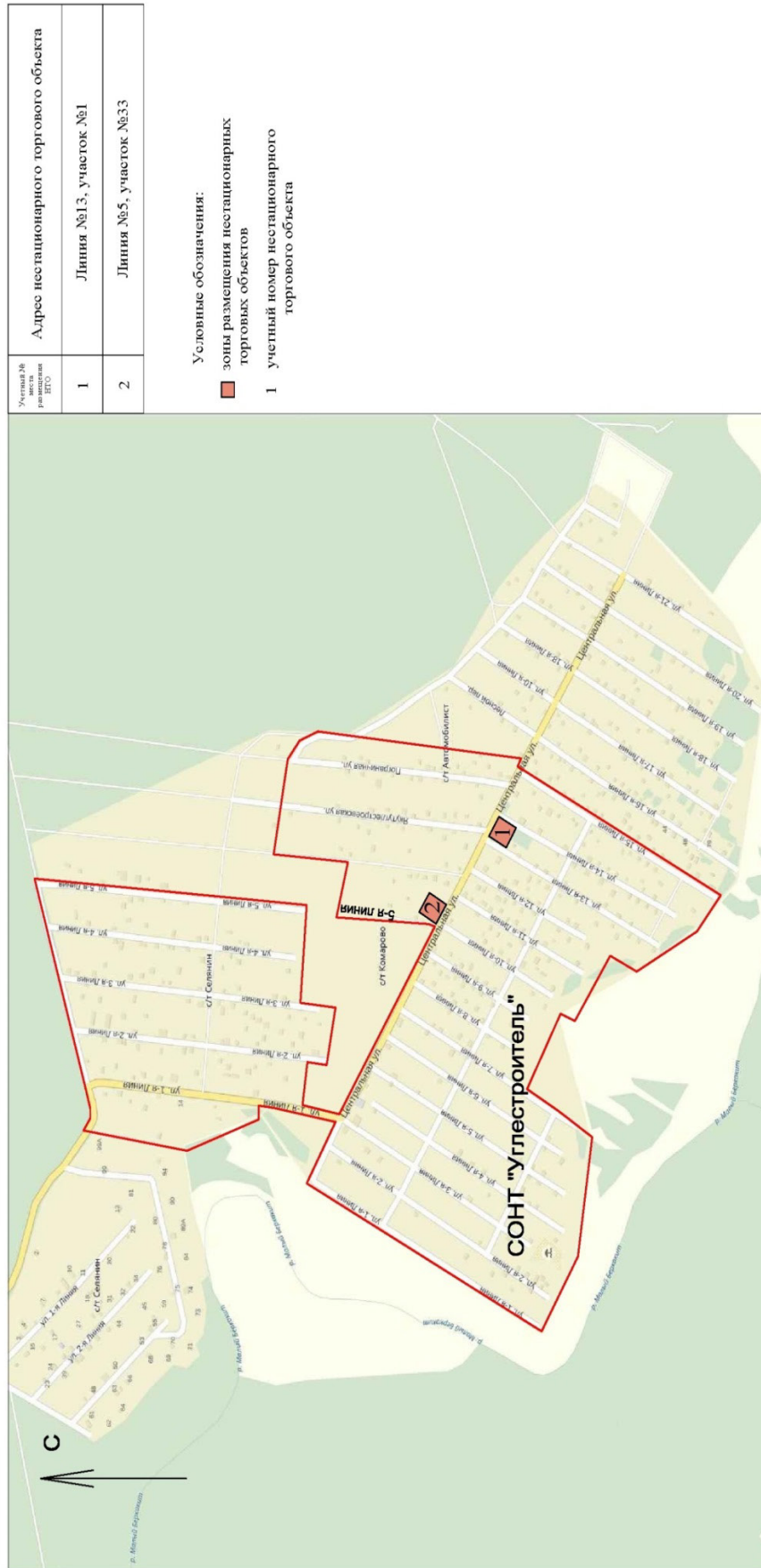
СХЕМА размещения нестационарных торговых объектов, расположенных на межселенных территориях муниципального образования "Нерюнгринский район"

УТВЕРЖДЕНА постановлением Нерюнгринской районной администрации от 09.04.2021 № 578 (приложение № 2)