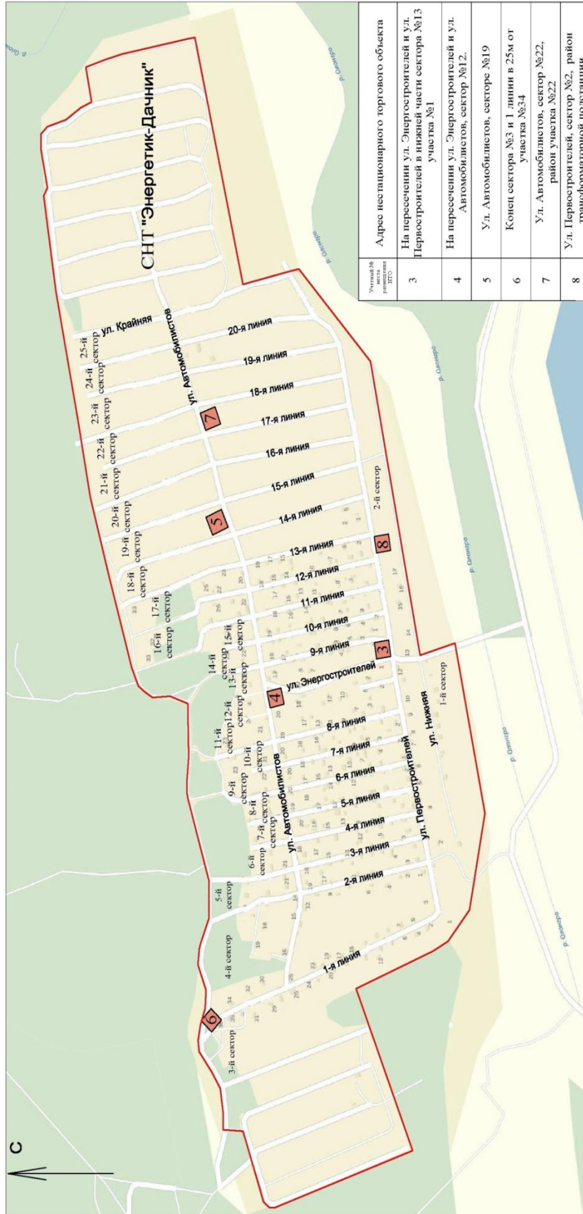
СХЕМА размещения нестационарных торговых объектов, расположенных на межселенных территориях муниципального образования "Нерюнгринский район"

Условные обозначения: ■ зоны размещения нестационарных торговых объектов 1 учетный номер нестационарного торгового объекта